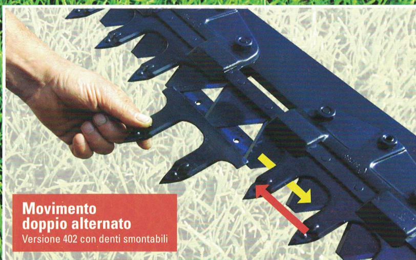
Movimento doppio alternato Versione 402 con denti smontabili