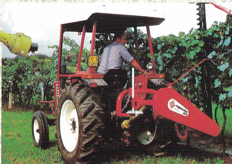
Possibilità di lavoro con barra in ogni posizione