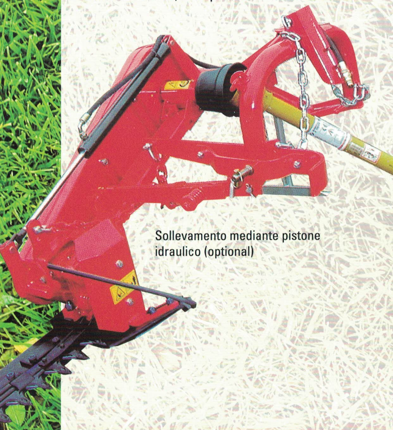
Sollevamento mediante pistone idraulico (optional)

Sharpening times have been cut down thank to the possibility of extracting the blade from the outside.