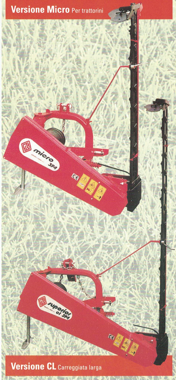
Versione CL Carreggiata larga